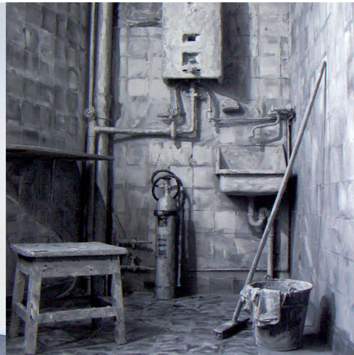
„Extinguisher 2006“, Mischtechnik. Übermalung eines vorgefundenen Raumes der ü.NN_hall, Attendorn.