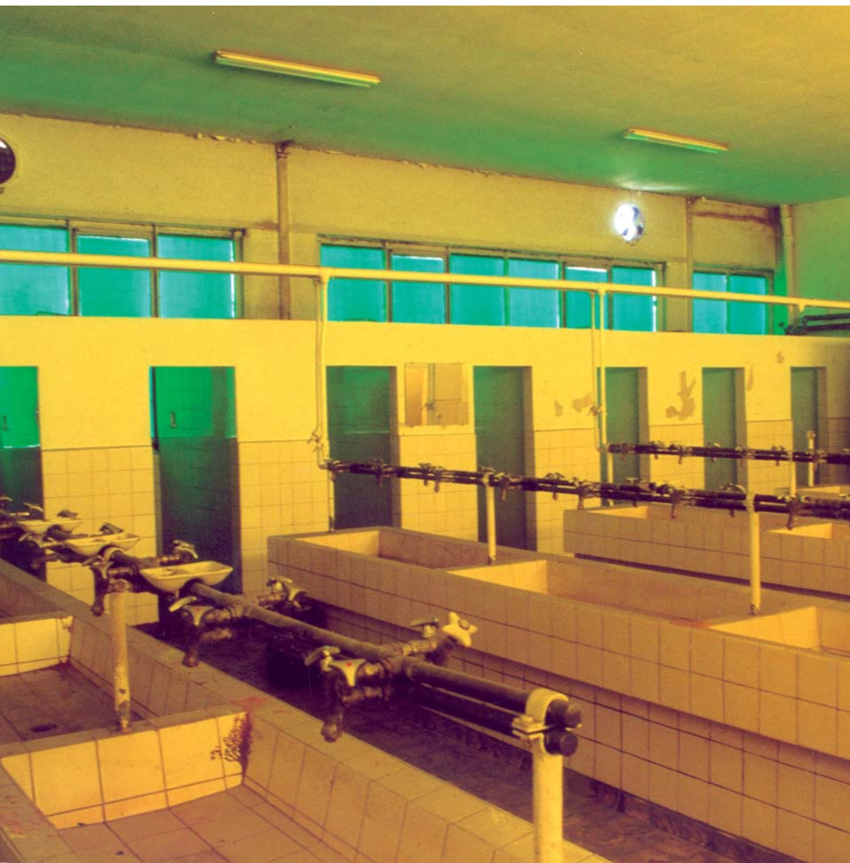
„Die Dusche“ 2000, Acryl auf Glas. Transluzide Bemalung der Fensterscheiben einer Männerdusche der ü.NN_hall, Attendorn.